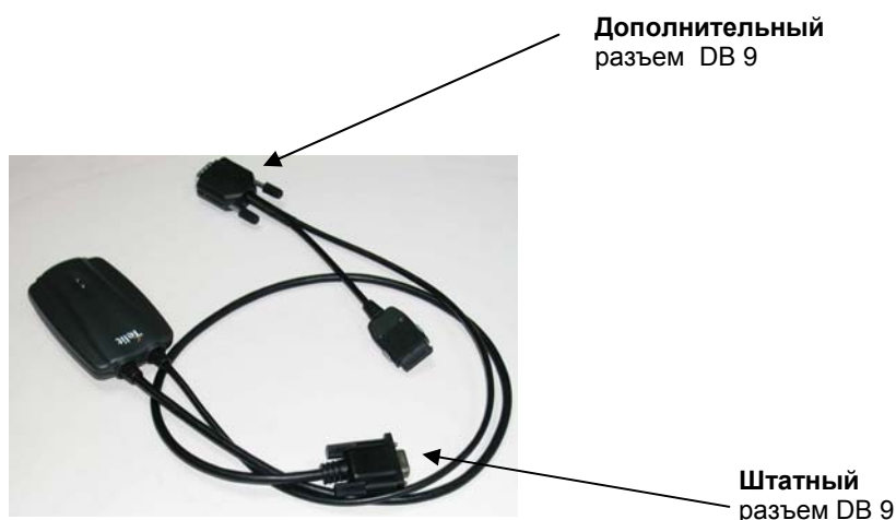
Рис. 3. Модернизированный адаптер DT 550.

Штатный разъем DB 9 адаптера DT 550 установлен на конце штатного кабеля, подключенного к адаптеру, а дополнительный разъем соединяется с адаптером и разъемом, предназначенным для подключения адаптера к абонентскому терминалу SAT 550 (см. рис. 3).