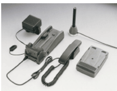
Рис. 1. Автомобильный комплект SAT 551.

Автомобильные (морские) комплекты SAT 551, 550X, 550XF обеспечивают голосовую связь с помощью штатных устройств: микрофон, динамик, телефонная трубка (см. рис. 1).